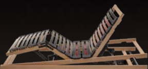
Reflux M2, wie M2 mit zusätzlichem 3. Motor für Reflux-Verstellung

MW 14485 – Maximale Flexibilität für individuelle Ansprüche – denn nur mit einem optimal abgestimmten Lattenrost kann eine Matratze ihr ganzes Komfortpotenzial entfalten.